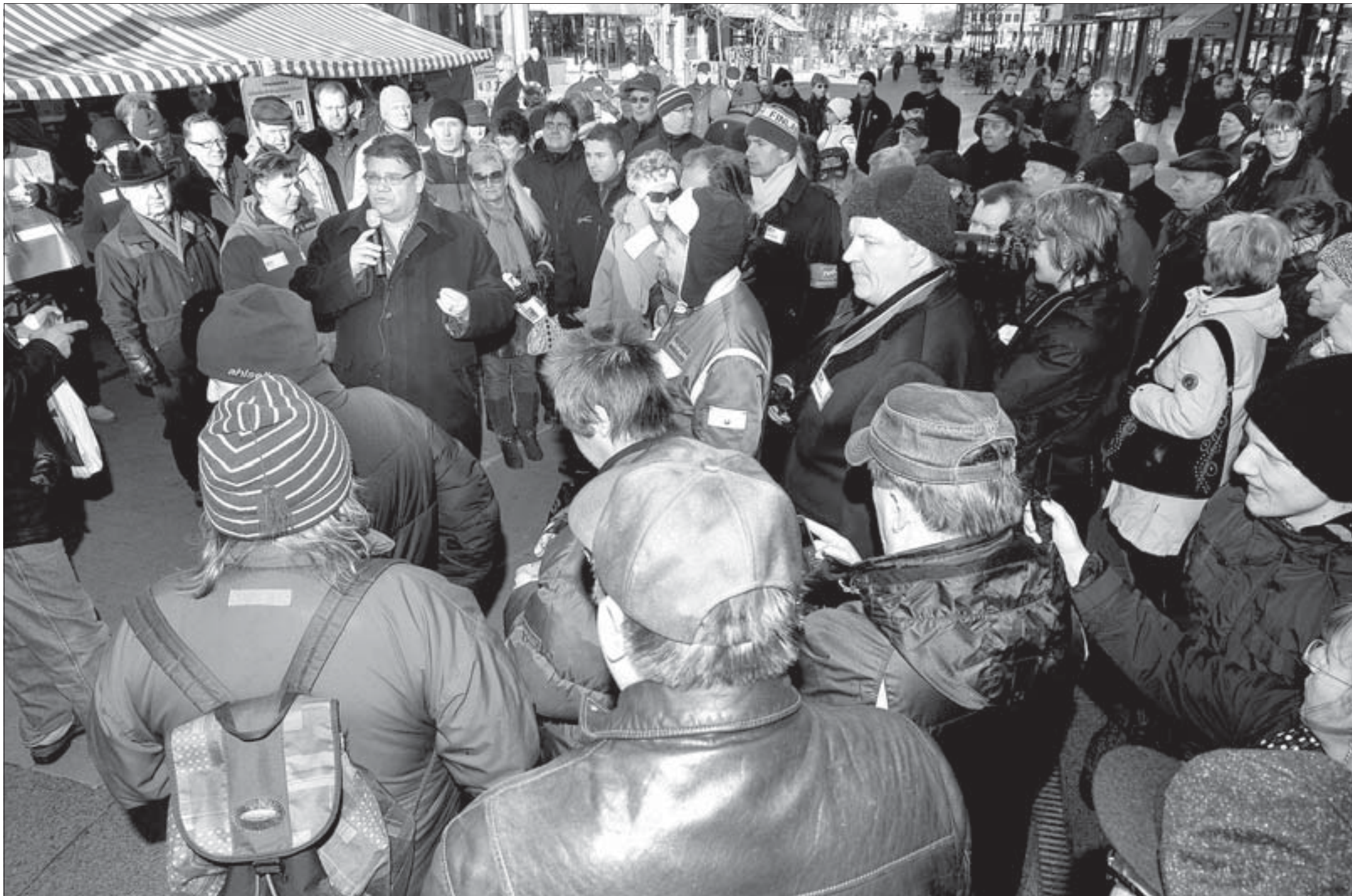
Timo Soini vaati Turussa suursäätiöitä verolle ja satsauksia omaishoitoon. – Omaishoitajien asemaa on parannettava. Se on meille kynnyksikysymys, Soini puhui.