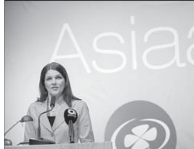
Mari Kiviniemi ehdottaa yhteiskuntasopimusta kilpailukyvyn parantamiseksi. Keskusta tavoittelee seuraavan vaalikauden aikana 150000–200000 uutta työpaikkaa.